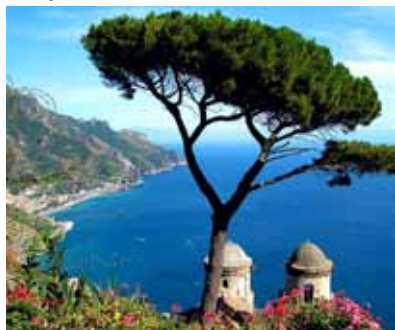
In Ravello, Amalfiküste