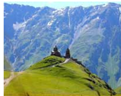
Kazbegi - Dreifaltigkeitskirche.

Im Hintergrund der erloschene Vulkan Kazbeg (5047m)