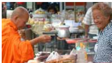
Marktszene in Nordthailand.